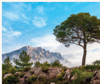
Montagne Sainte-Victoire, labellisée Grand Site de France