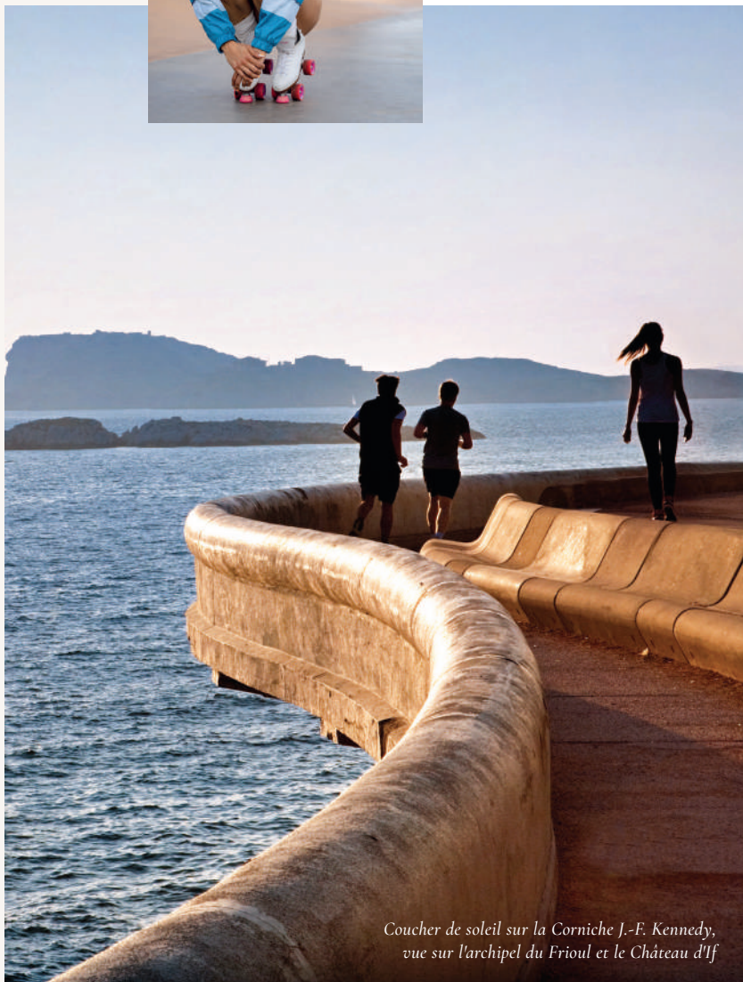
Coucher de soleil sur la Corniche J.-F. Kennedy, vue sur l'archipel du Frioul et le Château d'If

Dans une volonté constante d'évolution , certaines lignes de tramway ont même été prolongées afin d'étendre l'accessibilité sur tout son territoire.