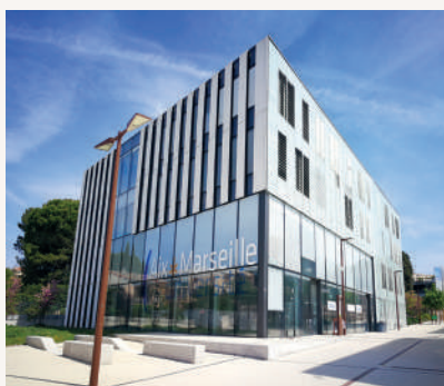
Aix-Marseille Université, Campus Aix-en-Provence