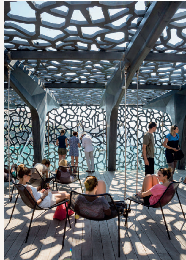
Rooftop du MUCEM

78 SITES PROTÉGÉS ET CLASSÉS AU TITRE DES MONUMENTS HISTORIQUES