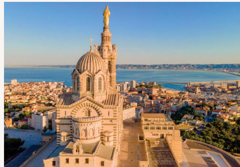
Marseille, vue d'ensemble avec la basilique Notre-Dame de la Garde