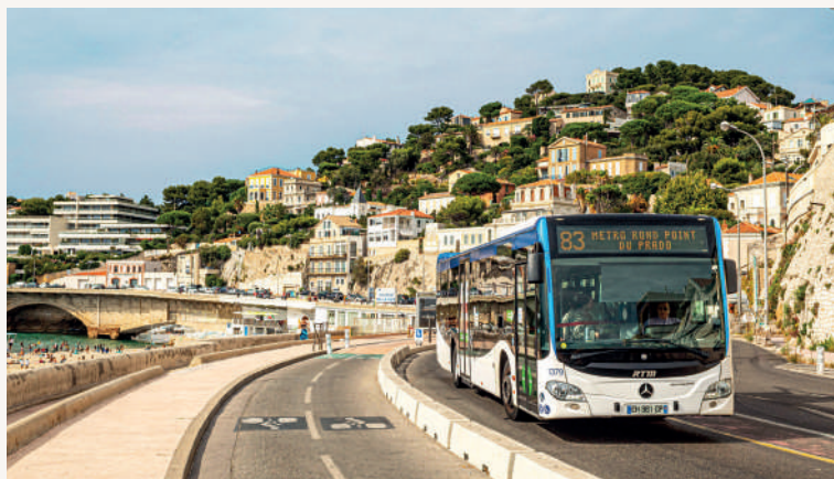
Marseille, Bus 83, Plage du Prophète