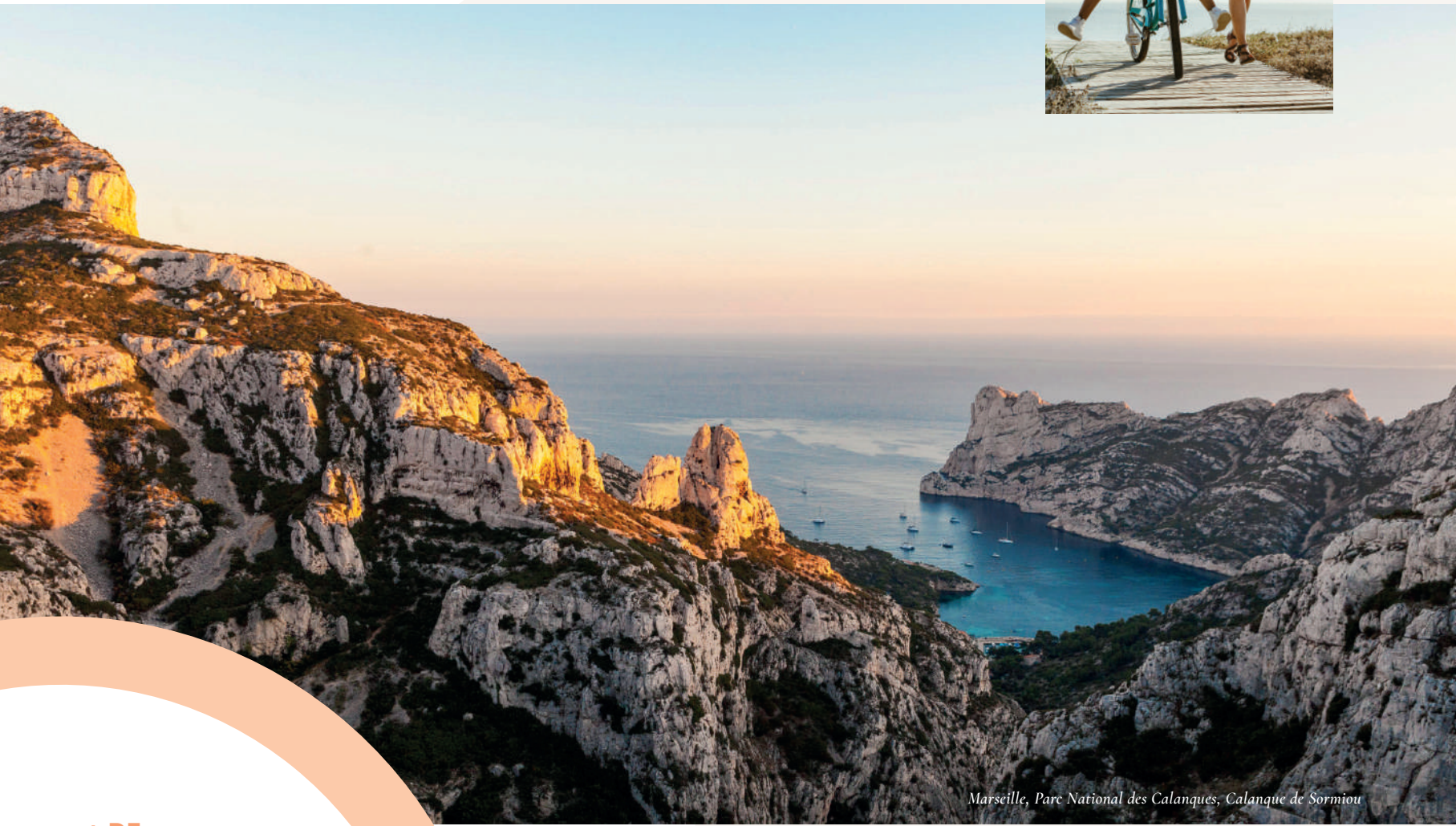
Marseille, Parc National des Calanques, Calanque de Sormiou

+ DE 1,92 MILLION D'HABITANTS* 92 COMMUNES 3 150 KM 2